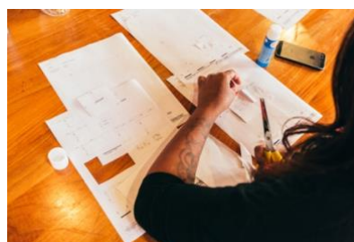
Juni 2017. Old school knippen en plakken voor je favoriete woningindeling.