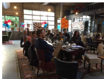
2017 – 2018. De sfeervolle Graasj als inspirerende locatie voor de bijeenkomsten met de architect.