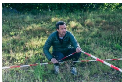
Juni 2017. In het echt: piketpaaltjes slaan op het terrein en de woningen 'uittekenen' met lint.